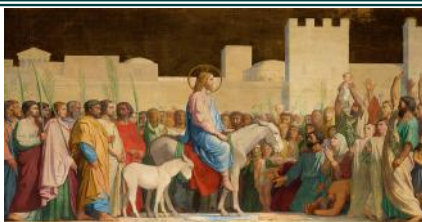
L'entrée du Christ à Jérusalem, Hippolyte Flandrin - 1844, Saint Germain des Prés , Paris