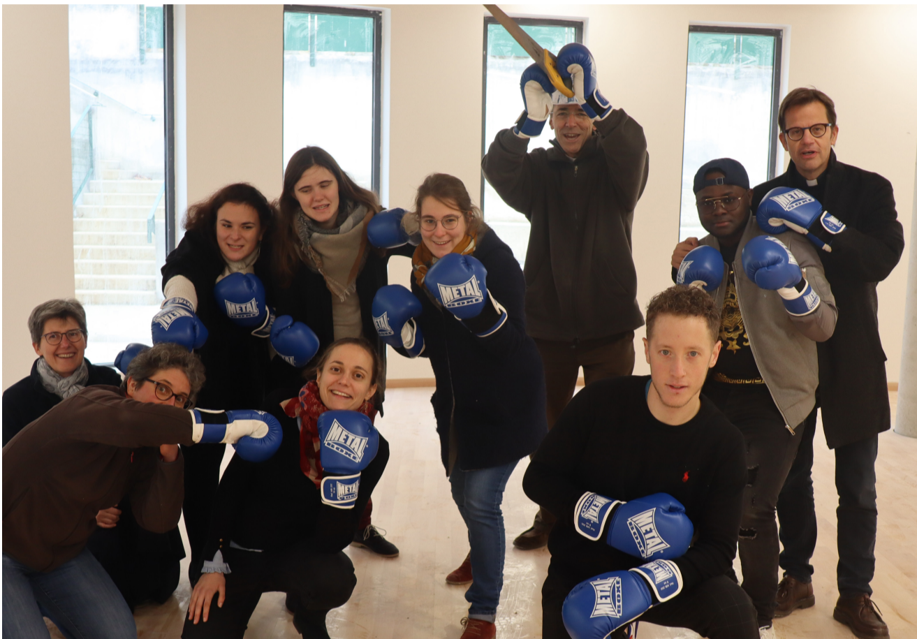
L'équipe aux commandes de la Maison des jeunes

Il y a toujours du soutien scolaire, toujours du foot... Mais, dans la version reconfigurée de la Maison des jeunes, la palette des activités est à la fois affinée en fonction des âges, élargie avec une capacité d'accueil deux fois plus importante et proposée sur des plages horaires plus longues avec, notamment, une ouverture le samedi après-midi. Une foule de nouveautés est à découvrir dans un livret mis à la disposition de tous par la Maison des jeunes.